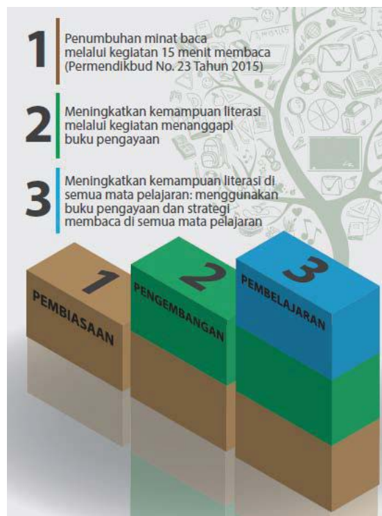
Gambar 1. Tahap-tahap Gerakan Literasi Sekolah

Dalam pelaksanaannya, GLS menetapkan adanya tiga tahap agar budaya literasi di sekolah dapat berkembang dengan baik dan menyeluruh. Diagram di bawah menunjukkan tahap GLS: